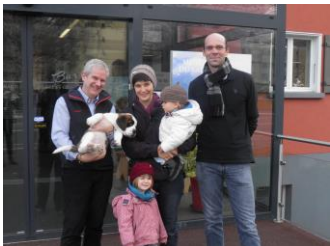
500 000 e visiteuse.jpg