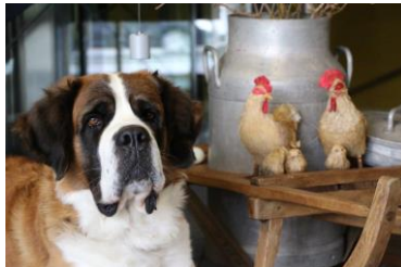
Pâques au Barryland_1.jpg