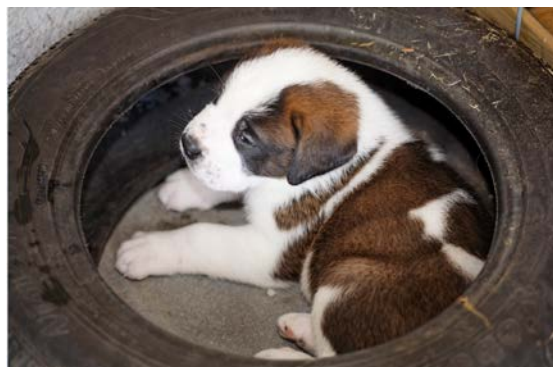
Welpen Rad.jpg