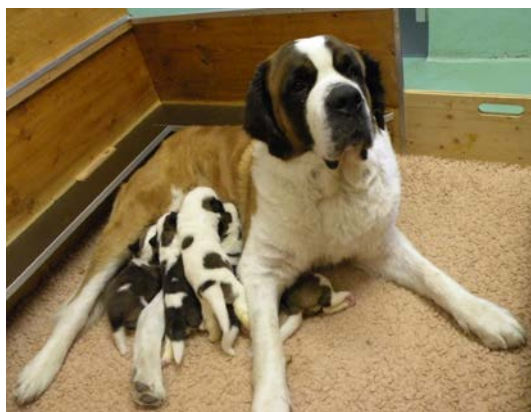
Welpen Gipsy.jpg