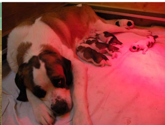
Welpen Thelma.jpg